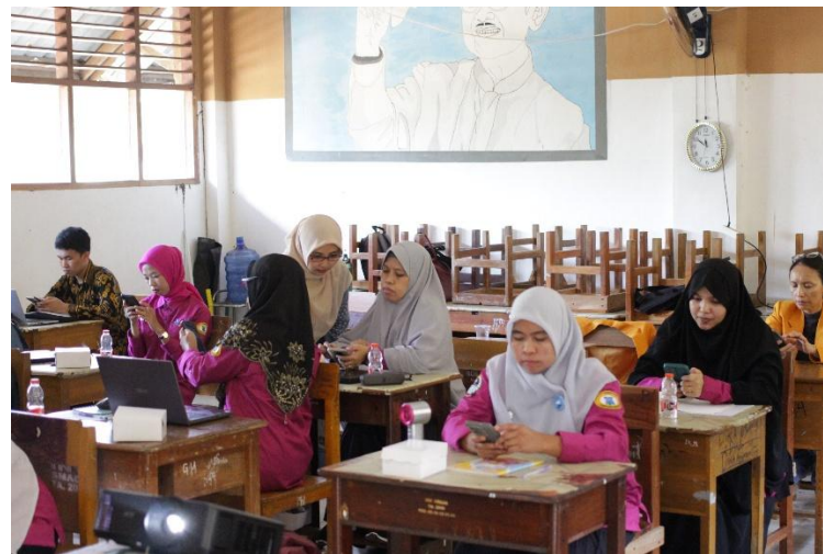
Gambar 2. Dokumentasi Pendampingan Kegiatan Pelatihan