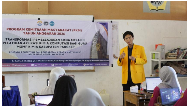
Gambar 1. Dokumentasi Pelaksanaan Kegiatan Pelatihan