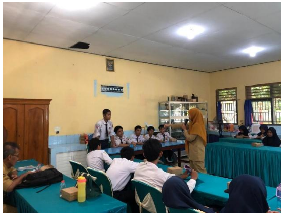
Gambar 3. Pembelajaran bahasa Inggris terstruktur oleh guru yang sudah mengikuti pelatihan.

serta mempraktikkan secara langsung percakapan sederhana. Berdasarkan hasil evaluasi akhir ( Final Quality Control ), sebanyak 18 dari 31 siswa ( \pm 58\% ) berhasil mencapai kriteria kelulusan yang ditetapkan. Data ini menunjukkan bahwa program ini mampu memberikan dampak nyata terhadap peningkatan kemampuan komunikasi siswa dalam waktu yang relatif singkat (Hanafiah et al., 2022).