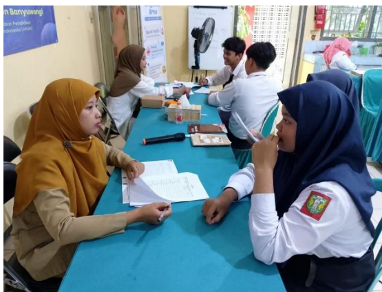
Gambar 4. Quality Control sebagai evaluasi yang dilaksanakan setiap akhir pembelajaran.

Selain itu, keterlibatan guru dalam proses evaluasi juga meningkatkan, yang ditunjukkan dengan kemampuan guru dalam memberikan umpan balik dan melakukan pendampingan terhadap siswa. Dari sisi implementasi, kegiatan pembiasaan bahasa juga menunjukkan peningkatan konsistensi, terutama setelah dilakukan penjadwalan dan pembagian peran guru secara lebih terstruktur. Sehingga program ini meskipun sudah selesai, pembiasaan tetap dilakukan secara berkelanjutan. Temuan ini sejalan dengan teori scaffolding yang menekankan peran guru dalam membantu siswa mengembangkan kemampuan melalui bimbingan secara bertahap. Dari sisi implementasi, kegiatan pembiasaan bahasa menunjukkan peningkatan konsistensi setelah adanya penjadwalan dan pembagian peran guru yang lebih terstruktur (Aisyah et al., 2025).