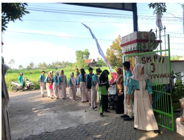
Gambar 2. Pembiasaan menyapa siswa di depan gerbang sekolah setiap pagi menggunakan bahasa Inggris.

Pada aspek pembiasaan bahasa ( English Environment ), terjadi peningkatan partisipasi guru dan siswa dalam penggunaan Bahasa Inggris. Dimulai dari kegiatan penyambutan siswa di depan gerbang sekolah setiap pagi hari, dimana siswa yang pada awalnya cenderung malu dan pasif, mulai menunjukkan respon yang lebih aktif dan bervariasi. Peningkatan kemampuan komunikasi bahasa Inggris melalui pendekatan English for Tourism terbukti efektif dalam meningkatkan kepercayaan diri peserta dan memberikan pemahaman tentang istilah-istilah pariwisata yang relevan (Halisa et al., 2025). Selain itu, penggunaan Bahasa Inggris mulai diintegrasikan dalam kegiatan pembelajaran di kelas. Mulai dari pembukaan kelas, instruksi kelas (izin masuk ruangan, izin ke kamar mandi, izin keluar kelas, dan lain-lain), serta dilakukan untuk komunikasi di luar kelas (pemberian pengumuman, pembukaan dan penutupan rapat, serta saat kegiatan ekstrakurikuler). Hal ini menunjukkan bahwa pembiasaan bahasa mampu membangun kepercayaan diri siswa dalam berkomunikasi secara bertahap (Munawwaroh & Zuhdi, 2025).