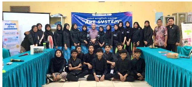
Gambar 6. Foto tim pengabdian dari kampus bersama siswa, YPAN, serta para guru.

Kegiatan pengabdian melalui pengembangan English Environment berbasis sekolah di SMP Negeri 3 Banyuwangi berhasil dilaksanakan dengan mengintegrasikan pembiasaan penggunaan bahasa Inggris dalam aktivitas sehari-hari dan pembelajaran terstruktur. Program ini terbukti efektif meningkatkan penggunaan bahasa Inggris di lingkungan sekolah, kemampuan komunikasi siswa, serta partisipasi guru dan siswa dalam membangun budaya komunikasi yang lebih aktif. Meskipun menghadapi kendala berupa keterbatasan waktu dan perbedaan kompetensi guru, program tetap menunjukkan hasil yang positif dan berpotensi untuk dikembangkan secara berkelanjutan guna mendukung penguatan sumber daya manusia yang relevan dengan kebutuhan pengembangan pariwisata dan geopark di Banyuwangi.