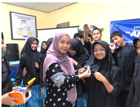
Gambar 5. Penyematan pin kepada Duta Bahasa Inggris terpilih.

Luaran dari kegiatan pengabdian ini meliputi terbentuknya English Environment lingkungan sekolah yang ditandai dengan meningkatnya penggunaan bahasa Inggris dalam aktivitas sehari-hari. Selain itu, dihasilkan pula perangkat pendukung pembelajaran, seperti modul, media pembelajaran, serta sistem evaluasi berkelanjutan berbasis Quality Control . Program ini juga menghasilkan 10 siswa yang berperan sebagai duta bahasa Inggris di Sekolah. Sepuluh mahasiswa ini merupakan siswa yang telah mencapai kriteria kelulusan dan memiliki kemampuan komunikasi yang lebih baik dari peserta lainnya. Duta Bahasa ini berperan sebagai role model sekaligus penggerak dalam mengimplementasikan dan membiasakan penggunaan bahasa Inggris di lingkungan sekolah. Mereka juga berperan dalam mendukung keberlanjutan program dengan membantu teman sebaya dalam praktik komunikasi. Selain itu, disusun juga rencana keberlanjutan program melalui pelaksanaan tahap lanjutan bagi siswa yang belum mencapai kriteria kelulusan (QC).