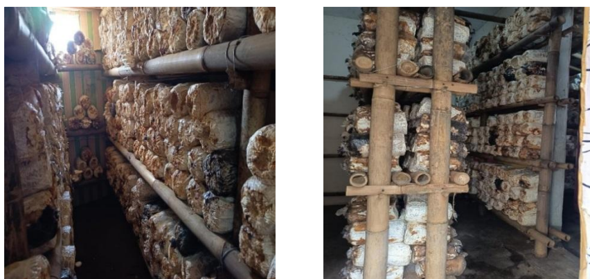
Gambar 1. Kumbung Jamur Desa Jatimukti

Aspek akuntansi yang dapat dirumuskan sebagai permasalahan dari mitra UMKM jamur tiram Desa Jatimukti adalah pertama, belum terstrukturinya pencatatan transaksi keuangan harian mitra berdasarkan standar akuntansi EMKM. Pencatatan yang dilakukan mitra hanya sebatas berapa uang masuk dan berapa uang keluar saja. Biaya yang dikeluarkan untuk proses produksi, biaya pengeluaran untuk operasional rutin, dan juga aset usaha belum dilakukan pengklasifikasian. Laporan keuangan baku seperti laporan laba rugi dan neraca juga belum pernah dibuat. Dari hasil penjualan yang diperoleh langsung dikelompokkan berapa nilai yang disetorkan untuk BUMDES (Badan Usaha Milik Desa), berapa nilai yang akan digunakan untuk pembelian baglog bibit jamur dan berapa nilai yang akan dibagikan sebagai upah pegawai. Kedua, harga pokok penjualan (HPP) yang masih sulit untuk dipahami oleh mitra. HPP ini diperlukan juga dalam menentukan besaran harga jual dari jamur tiram. Perhitungan biaya yang lebih kompleks dan sedikit rumit akan diperlukan jika suatu saat mitra ingin meningkatkan kapasitas produknya melalui diversifikasi produk. Pengetahuan tentang inilah yang perlu dimiliki oleh mitra.