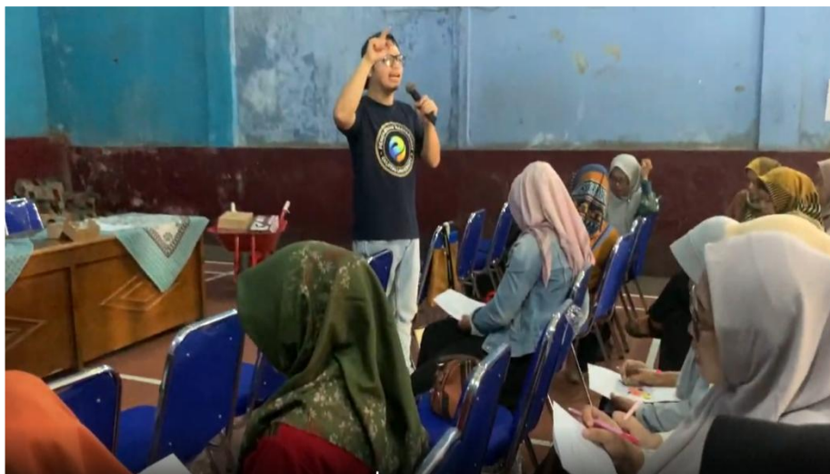
Gambar 6. Pemaparan Materi Keuangan Sederhana