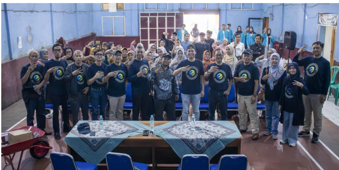
Gambar 9. Foto Kegiatan