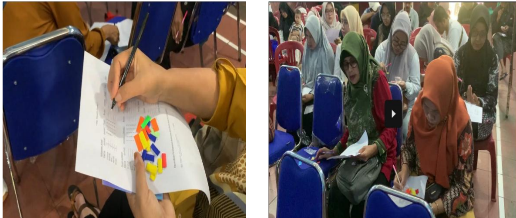
Gambar 7. Sesi Permainan tentang Keuangan Sederhana