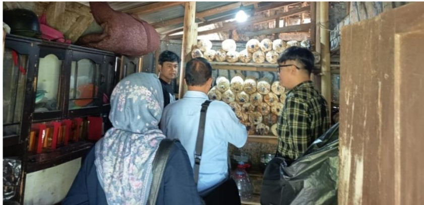
Gambar 2. Kunjungan Awal ke Mitra UMKM