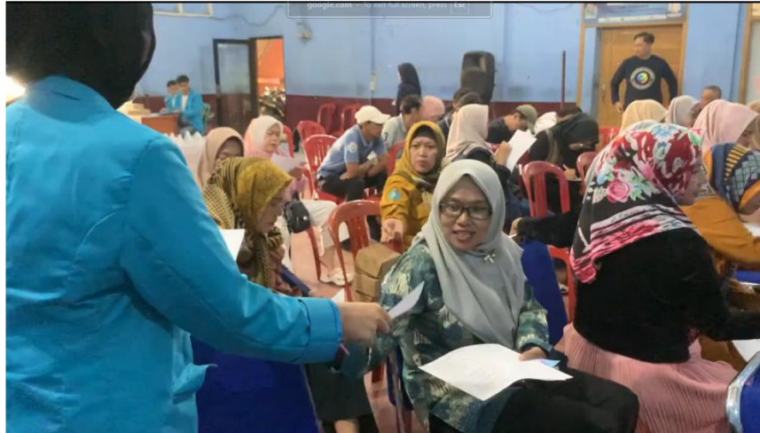
Gambar 5. Pengisian formulir pre-test