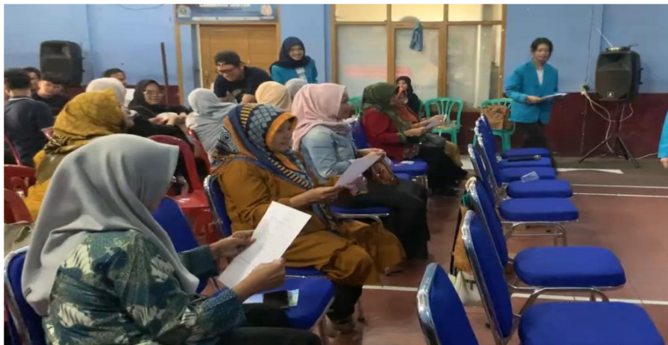
Gambar 8. Pengisian form post-test