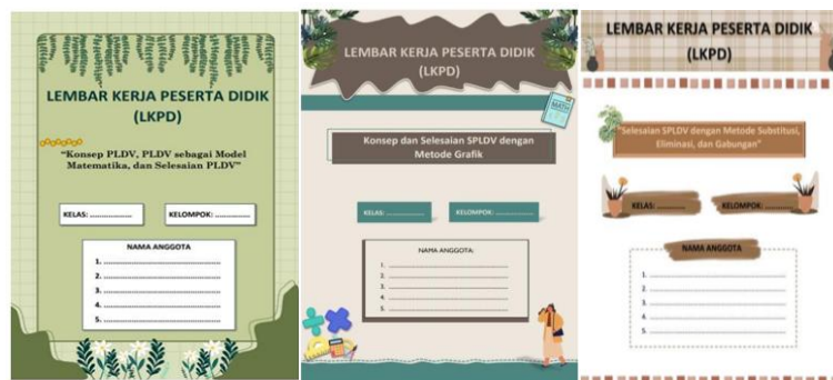
Gambar 1. Rancangan Awal LKPD

Tahap ini diawali dengan pemilihan media, peneliti melakukan analisis kebutuhan berdasarkan hasil analisis yang menjadi acuan dan faktor yang perlu diperhatikan dalam pemilihan media yang dibuat yaitu media cetak berupa LKPD berkarakteristik budaya lokal yang digunakan sebagai media pembelajaran di kelas. Tahap pemilihan format pada penelitian ini diisi dari LKPD yang akan disusun dengan merancang template , background, tulisan, dan beberapa gambar budaya lokal yang dimunculkan dalam LKPD. LKPD yang dikembangkan terdiri dari judul, tujuan pembelajaran, alokasi waktu, petunjuk penggunaan, materi, serta latihan soal. Rancangan awal LKPD yang ditunjukkan pada Gambar 2.