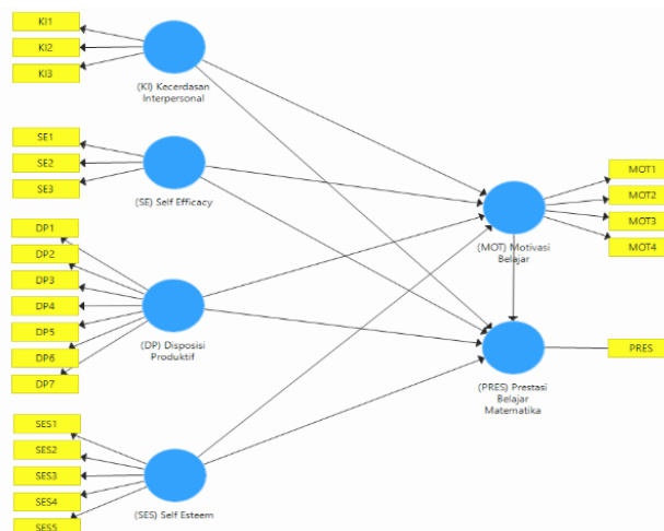
Gambar 1. Model Penelitian

Hubungan antar variabel, pengaruh langsung dan tidak langsung, total efek, perbandingan pengaruh langsung dan tidak langsung dievaluasi dengan menggunakan teknik statistika deskriptif dan inferensial, yakni Structural Equation Modeling (SEM) berjenis Partial Least Squares (PLS) dan berpedoman pada Hair dkk. (2021; 2022). Gambar 1 menunjukkan desain penelitian: